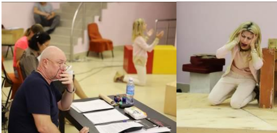
Фото с репетиционного процесса / Φωτογραφίες από τις πρόβες.

В ходе расследования убийцы, постепенно раскрывается истина, герой обнаруживает, кто он есть на самом деле.