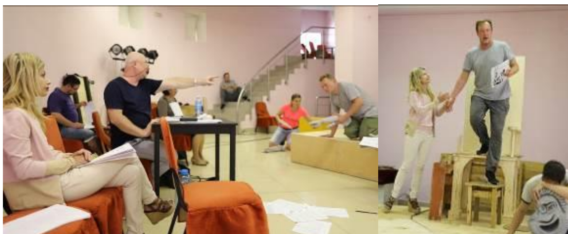
Φoto c репетиционного процесса / Φωτογραφίες από τις πρόβες.

Τη Θήβα ταλαιπωρεί ένας φοβερός λοιμός. Ο χρησμός ορίζει ότι η πόλη θα σωθεί μόνον αν τιμωρηθεί ο δολοφόνος του προηγούμενου βασιλιά Λαίου. Ο Οιδίπους, που βασιλεύει τώρα, ζητά να βρεθεί εκείνος, που σκότωσε το Λαίο. Ο μάντης Τειρεσίας κατηγορεί τον Οιδίποδα ότι εκείνος είναι το μίasma της πόλης. Ο Οιδίποδας εξαγριώνεται, καθώς υποψιάζεται συνωμοσία εναντίον του. Στην πορεία αναζήτησης του δολοφόνου αποκαλύπτεται σταδιακά η αλήθεια, ο ήρωας ανακαλύπτει ποιός πραγματικά είναι.