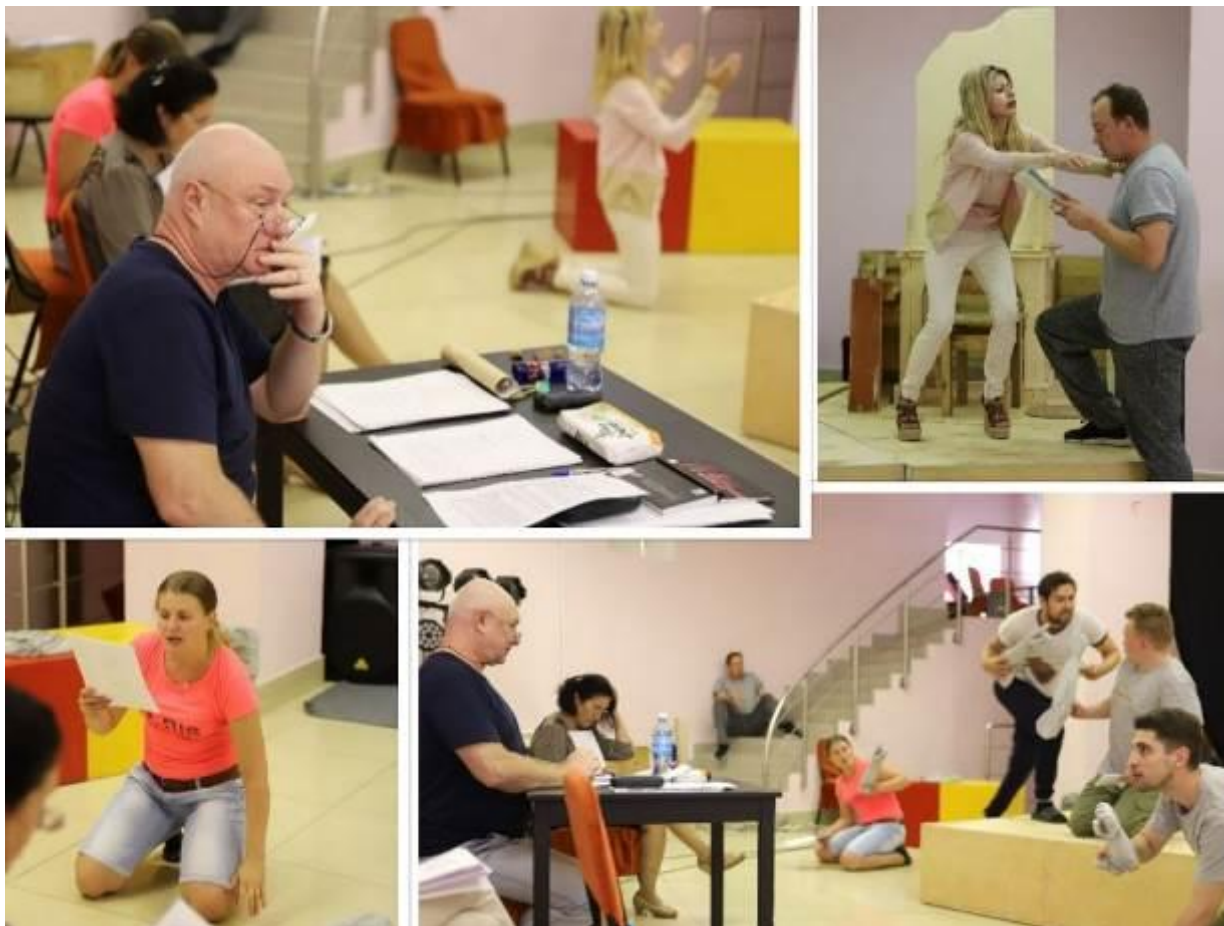
Φωτο ε repetιτιονηνογο προεεσα / Φωτογραφίεσ από τιεσ πρόβεσ.

ὦ πάτρασ Θήβησ ἔνοικοι, λεύσσετ', Οἰδίπουσ ὄδε, ὄσ τὰ κλείν' αἰνίγματ' ἤδει καὶ κράτιστοσ ἦν ἀνὴρ, οὐ τίσ οὐ ζήλω πολιτῶν ἦν τύχαισ ἐπιβλέπων, εἰσ ὄσον κλύδωνα δεινῆσ συμφορᾶσ ἐλήλυθεν. ὥστε θνητὸν ὄντα κείνην τὴν τελευταίαν ιδεῖν ἡμέραν ἐπισκοποῦντα μηδέν' ὀλβίζειν, πρὶν ἂν τέρμα τοῦ βίου περάσῃ μηδὲν ἀλγεινὸν παθῶν.